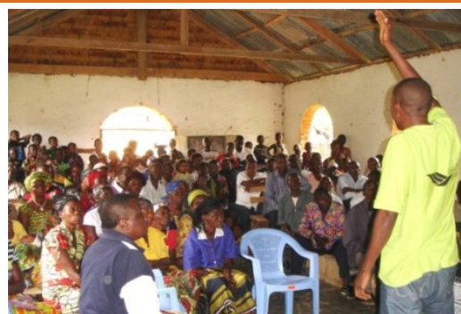
Terugkoppeling van het bezoek aan de leden in Tsinga