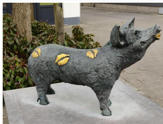
Standbeeld 'Zogge kust kunst' (Jo Bocklandt) op het centrale plein. Geef het Zeugje gerust een kusje!

In Zogge dorp zijn er enkele horecazaken. In het midden van de tocht, ter hoogte van Lippeveld is er ook een caf  tjeje.