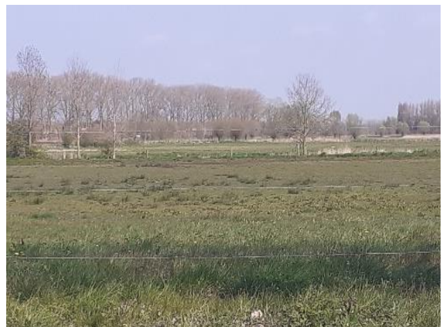
(4) De wijde natuur