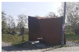
(1) Infobord Kerklaan