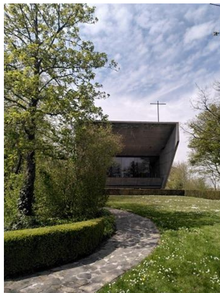
OLV Van Kerselarekapel